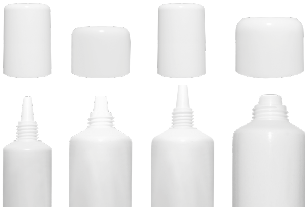
ø 19 [ NO COEX ] ø 25 ø 25 new ø 30